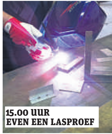
15.00 UUR EVEN EEN LASPROEF