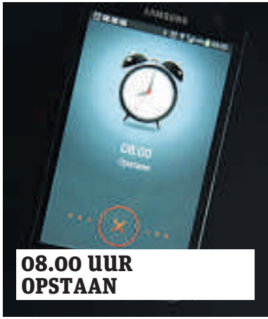
08.00 UUR OPSTAAN