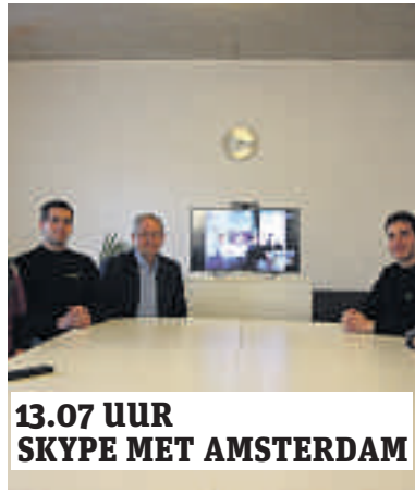
13.07 UUR SKYPE MET AMSTERDAM