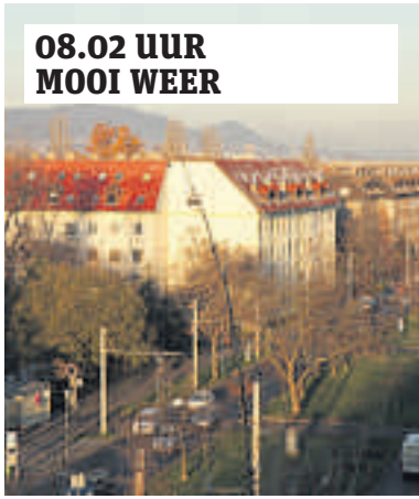
08.02 UUR MOOI WEER