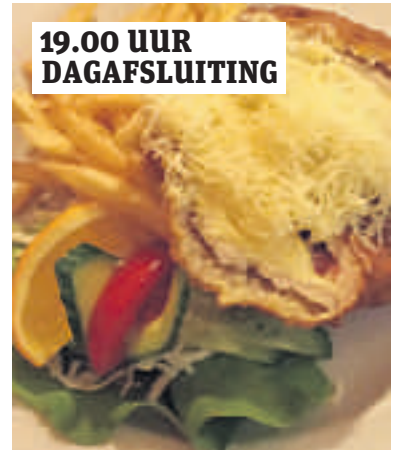
19.00 UUR DAGAFSLUITING